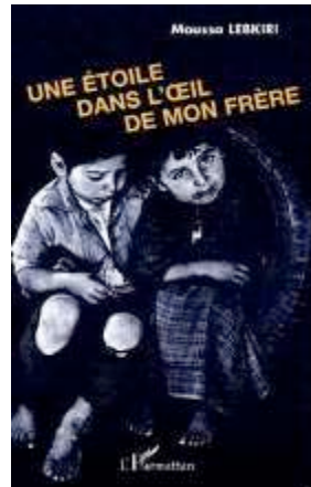
Une étoile Histoires de Kabylie