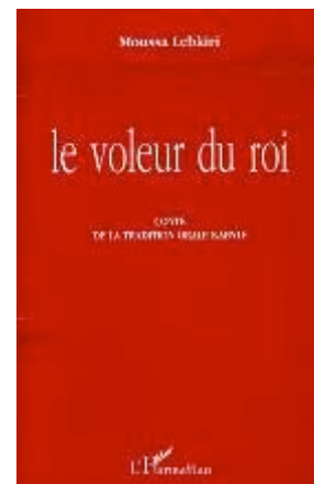
le voleur du roi Contes traditionnels