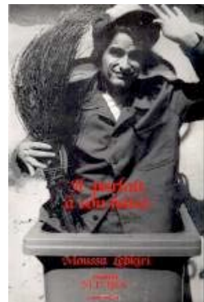
Il parlait à son balai Théâtre