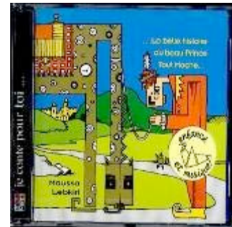
La belle histoire Contes sur CD