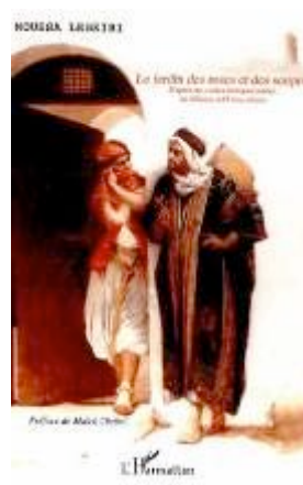
Le Jardin des roses Contes érotiques arabes