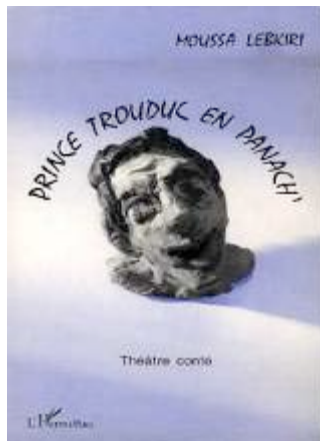
Prince Trouduc Contes Théâtre