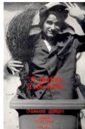
Il parlait à son balai Théâtre