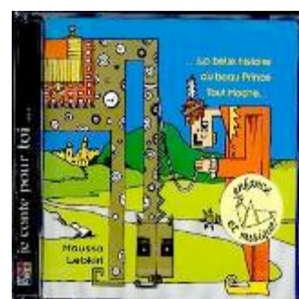
La belle histoire Contes sur CD