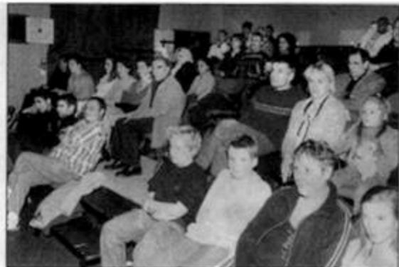
A l'issue du spectacle, un débat s'est ouvert entre l'artiste et les spectateurs.

famille à l'âge de 9 ans, Moussa a découvert un monde nouveau : "J'étais fasciné par la modernité, c'était comme dans un conte de fées", explique-t-il. Et c'est avec les yeux et le langage parfois maladroit d'un enfant que le conteur a souligné les particularités de la France et les souvenirs de ses premières années avec humour mais aussi avec émotion. "Je ne voulais pas faire un one man show, il n'y a pas un rire toutes les deux minutes. Ce sont des