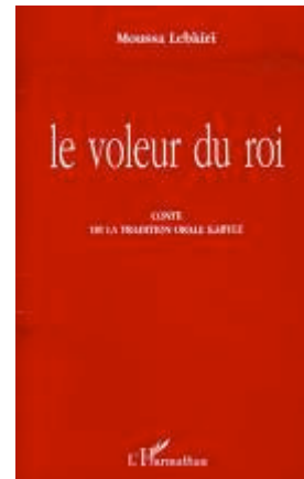
Le voleur du roi Contes traditionnels