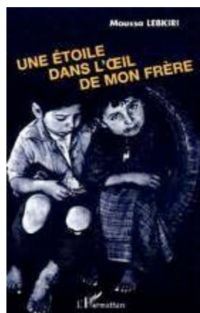
Une étoile Histoires de Kabylie