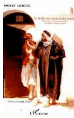
Le Jardin des roses Contes érotiques arabes