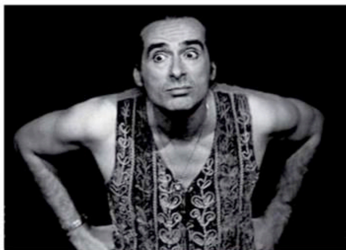
Être "mahboule" n'est pas donné à tout le monde...

SPECTACLE TOUT PUBLIC DÈS 10 ANS. CONTACT : 03 81 99 22 57.