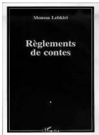
Règlements de contes Contes burlesques